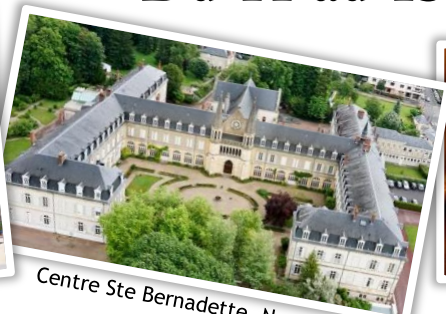
Centre Ste Bernadette, Nevers