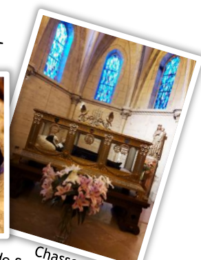
Chasse de Ste Bernadette